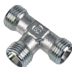
TN 100 R – Samler, T, reduktion